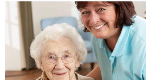
Modelo de atención centrada en la persona Cuadernos prácticos

Quines consideracions cal tenir en compte?